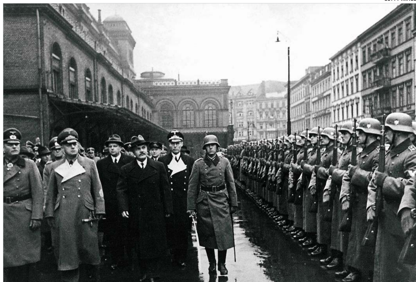
Molotov (keskellä) otettiin vastaan Berliinin Anhalter Bahnhofilla sotilaallisilla kunnianosoituksin. Hänen seurassaan olivat muiden muassa kenttämarsalkka Wilhelm Keitel (vas.) ja ulkoministeri Joachim von Ribbentrop (Molotovin takana vasemmalla).